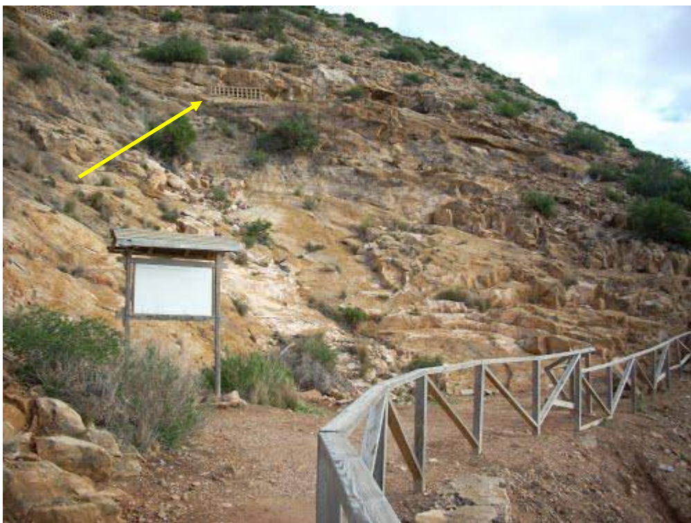
Arriba: llegada a la explanada ante la Sima de las palomas. La flecha amarilla señala la reja del corte superior.