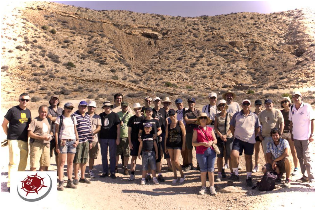
Foto de la visita del año pasado